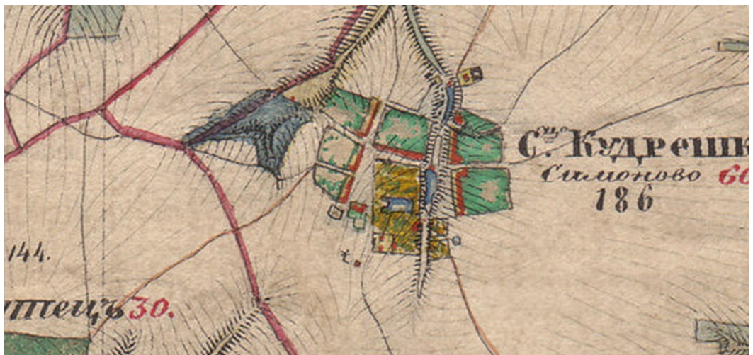
Сельцо Кудрешки по «Съемке Менде». Сер. XIX в. (РГАДА)