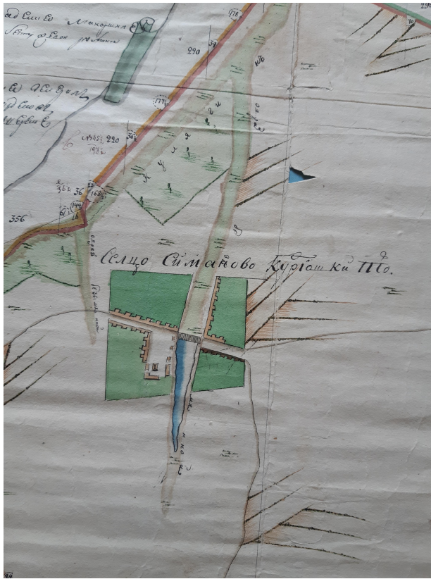
«Сельцо Симаново Курдюшки тож» по плану Генерального межевания. 1786 г. (РГАДА)